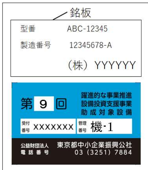
銘板と管理ラベルの写真（例示）

銘板の刻印が不鮮明な場合は写真の露出や明暗を補正したり、可能な限り拡大したり、その他工夫し写真から製造番号等が判別可能となるように工夫してください